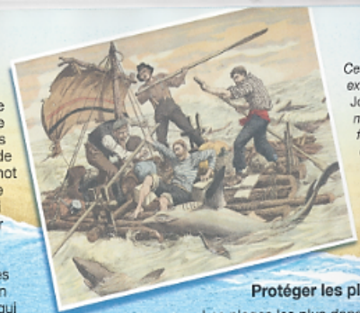
Cette gravure extraite du Petit Journal illustré montre des forçats évadés du bagne de l'île du Diable, en Guyane, aux prises avec des requins.

Autrefois, les marins racontaient que des requins avides de chair humaine poursuivaient leur bateau. En fait, les requins étaient attirés par les restes de nourriture jetés par-dessus bord. Le mot requin vient de « requiem », la prière pour les morts, car tout homme qui voyait un requin pouvait se préparer à mourir ! Aujourd'hui, on sait que le requin n'est pas l'être malfaisant toujours en quête de proies humaines que l'on a si longtemps décrit. Il n'en reste pas moins un prédateur féroce qui peut s'avérer très dangereux dans certaines circonstances.