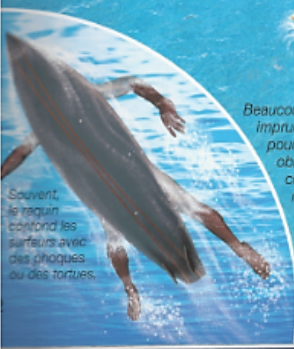
Souvent, le requin contourne les surfeurs avec des phoques ou des tortues.

Gare aux baigneurs indisciplinés qui ne respectent pas les bouées et les panneaux signalant la présence de requins !